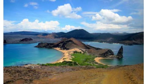
(参考写真：ガラパゴス諸島-バルトロメ島の風景)