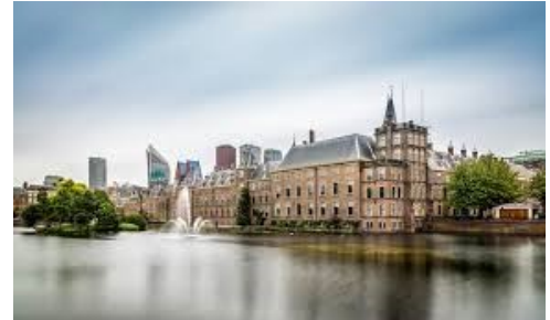
(参考写真：オランダの国会議事堂)

参加者は、一番印象に残った情報やオランダと日本との文化の違い、EUやオランダの統治と日本との違いについてプレゼンテーションをします。