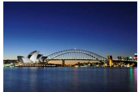
(参考写真：Sydney Harbour Bridgeの夜景)