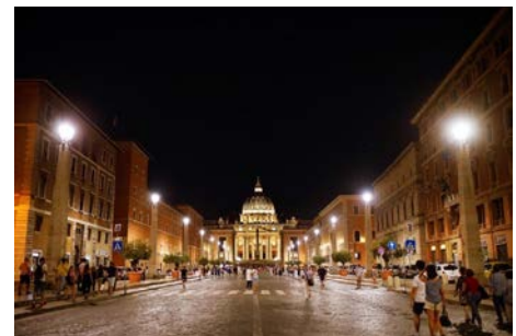
(参考写真：サン・ピエトロ大聖堂)