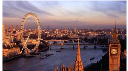
(参考写真：ロンドンの風景)