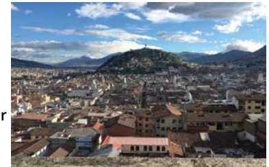
(参考写真：キトの街の風景)