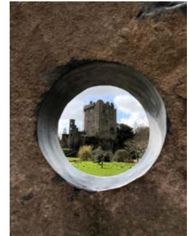
(参考写真：ダブリン城)

参加者は、グループで新製品またはマーケティングツールを考え、日本とアイルランドの市場に売り込む方法について発表します。