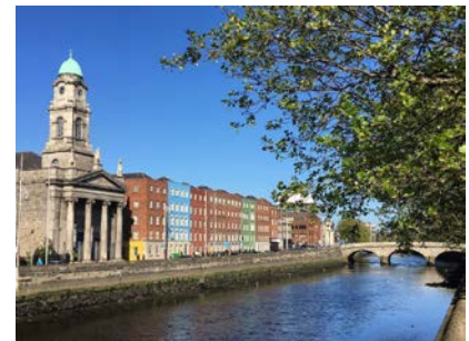
(参考写真：ダブリンの街並み)