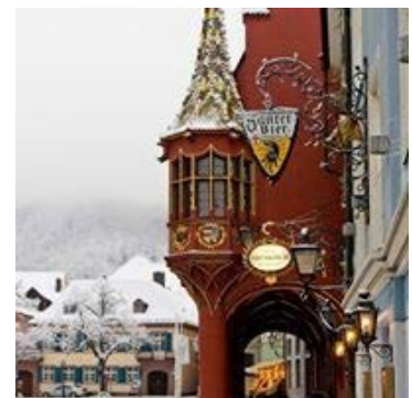
(参考写真：フライブルクの街)