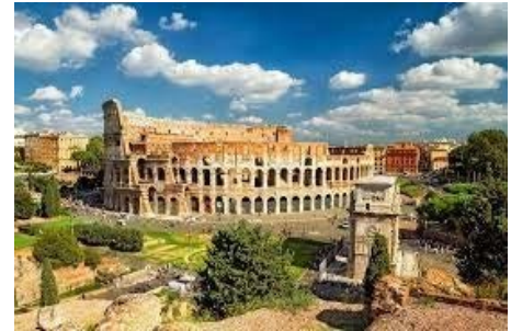
(参考写真：コロッセウム)

参加者は、プログラム中一番気に入った作品や建築・建造物を選び、その歴史や作者等についての背景と、それを選出した理由を発表します。