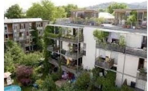
(参考写真：Vauban 持続可能モデル地区)

参加者は、フライブルクから学んだ都市計画や政策をヒントに、日本の将来のために持続可能な都市計画や政策を発表します。