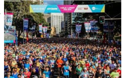
(参考写真：City2Surfマラソン大会の様子)