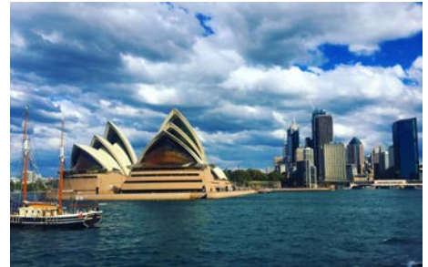
(参考写真：Sydney Opera House)

日本とオーストラリアの経済関係を理解した上で、ビジネス文化の違いについてプレゼンテーションを行います。