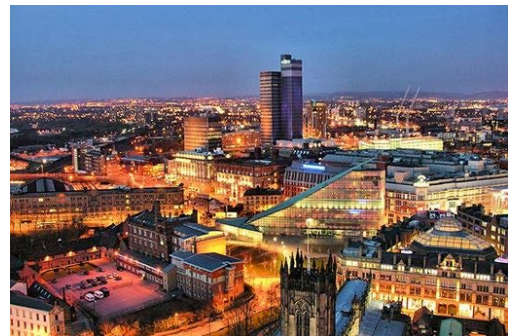
(参考写真：ロンドンの夜景)