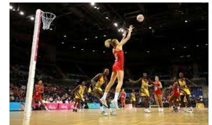
(参考写真：ネットボール 試合の様子)